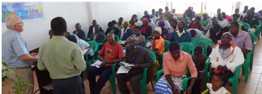
Bible study in LILONGWE <