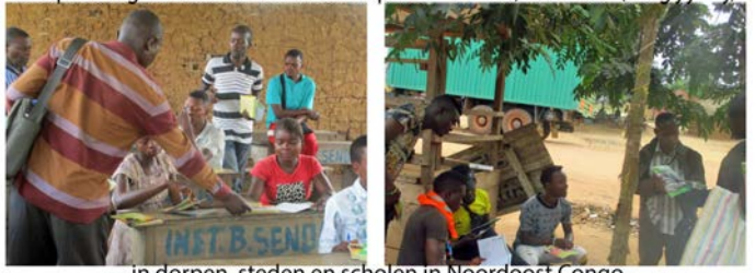
in dorpen, steden en scholen in Noordoost Congo

Met hartelijke groeten in onze trouwe Heer,