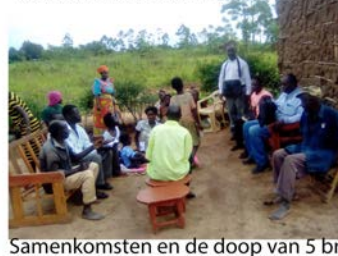
Samenkomsten en de doop van 5 broeders en zusters in Uganda