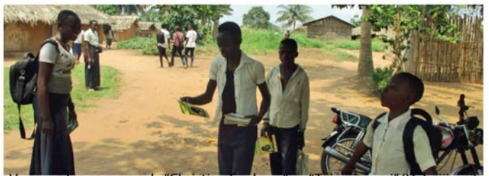
Verspreiding van o.a. de "Christian Explorer" en "Toi, suis-moi" (Volg jij mij)