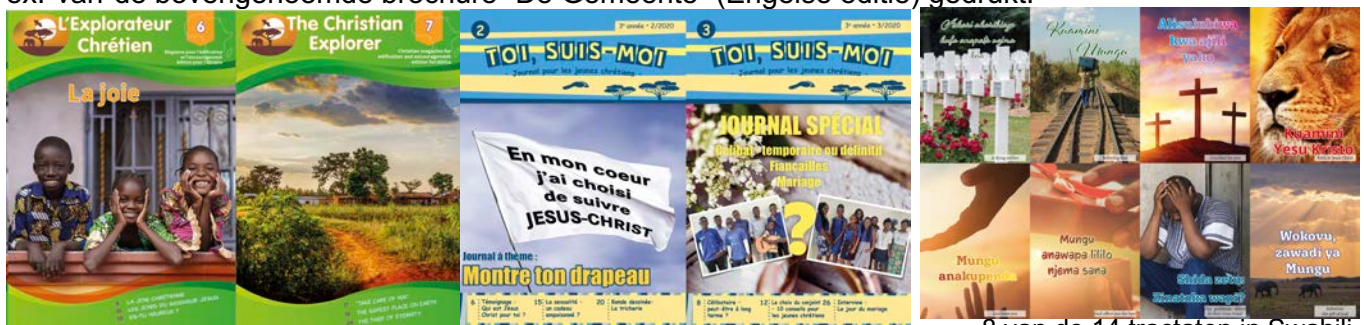
8 van de 14 tractaten in Swahili

Van de jeugdtijdschriften zijn de nummers van januari tot september gedrukt en verspreid en/of verzonden naar de eindbestemmingen in Uganda, Kenya en Noordoost Congo: “Toi, suis-moi” (10.000 ex. per keer), “L’Explorateur Chrétien” (10.000 ex.) “The Christian Explorer” (15.000 ex.). De volgende nummers van 2020 liggen nu bij de drukker en zullen binnenkort geleverd worden. Van “The Christian Explorer” worden 5000 ex. per keer gedrukt in Zuid-Afrika. Dezelfde drukker heeft ook 2000 ex. van de bovengenoemde brochure “De Gemeente” (Engelse editie) gedrukt.