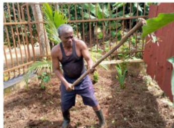
Het dagelijkse zware werk op de velden in de dorpen