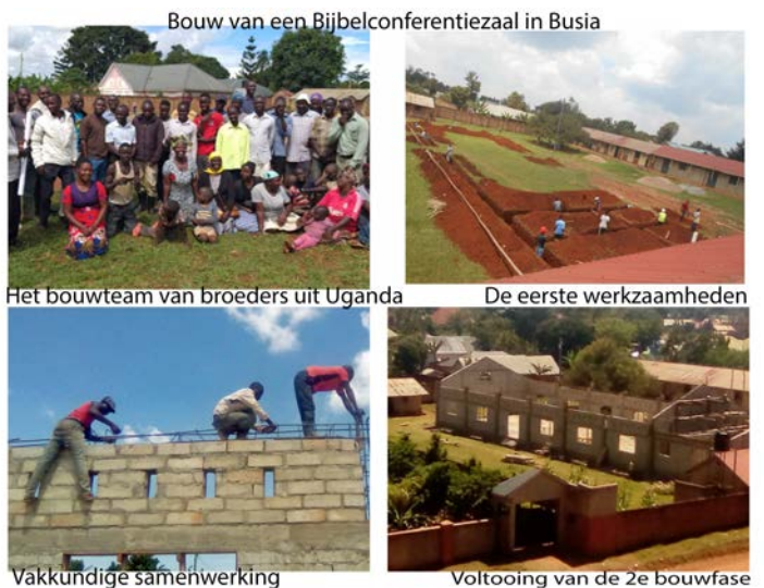
Bouw van een Bijbelconferentiezaal in Busia

Gisteren werd de tweede fase van de bouw afgesloten en op het moment dat ik dit schrijf zijn de leden van het bouwteam op weg naar hun dorpen in afwachting van de derde bouwfase.