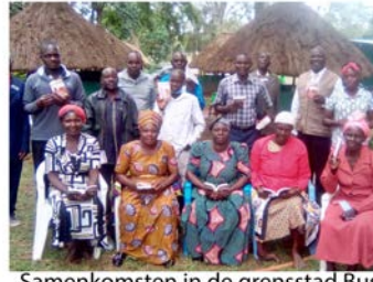
Samenkomsten in de grensstad Busia (Uganda en Kenia)