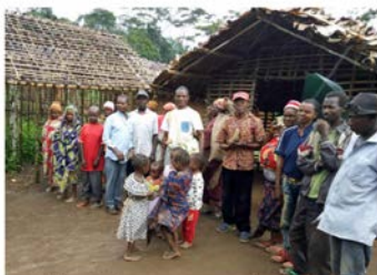
Bezoeken en samenkomsten in dorpen in Noordoost Congo