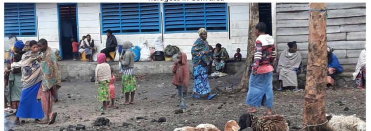
Refugees in Gom area

Les enfants des rues, orphelins, sans abri à cause des combats ou abandonnés, qui récupèrent les restes de nourriture jetés dans les restaurants.