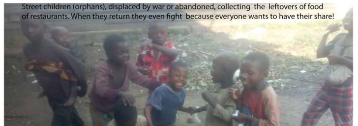
Street children (orphans), displaced by war or abandoned, collecting the leftovers of food of restaurants. When they return they even fight because everyone wants to have their share!